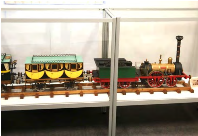
Model prvního parního vlaku, vůz I. třídy.