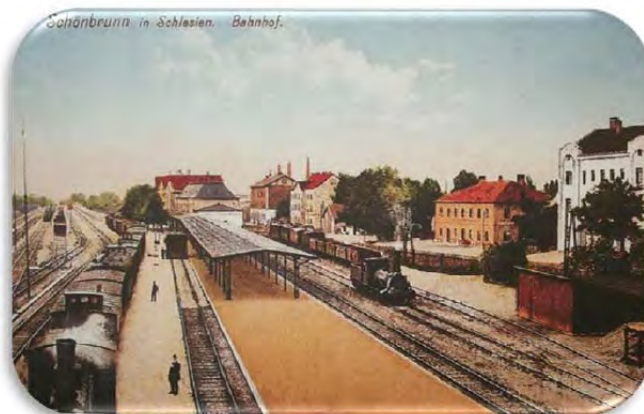
Nádraží ve Svinově (Schönbrunn) v roce 1910.

U příležitosti 170. výročí příjezdu prvního vlaku po Severní dráze císaře Ferdinanda do Bohumína připravilo Železniční muzeum moravskoslezské výstavu s názvem „170. let trati Severní dráhy císaře Ferdinanda, Lipník – Bohumín“. Měli jsme štěstí, že jsme si ji mohli prohlédnout.