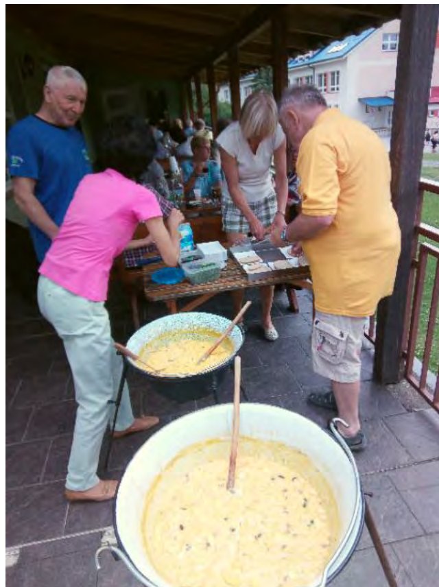
Smaženice z 200 vajčiek v loňském roce.

Účastnický poplatek: 100,- Kč na osobu (za to bude vaječina s chlebem, minerálky). Účastník dostane bloček na 30 Kč, za který si může zakoupit kávu, čaj, pivo či cokoli jiného. Při vyšší útratě si rozdíl doplatí. Tím se zajistí alespoň minimální útrata, neboť majitel restaurace po nás nepožaduje nájem.