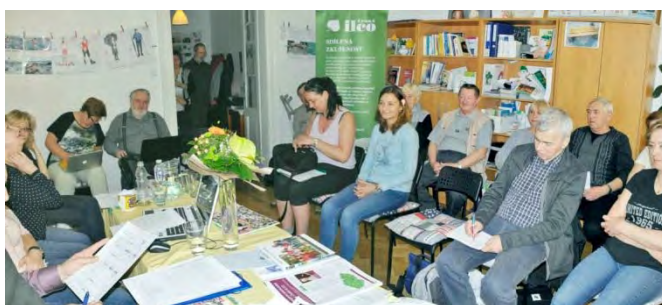
Účastníci jarního zasedání Českého ILCO.

se jednalo o změně zákona 48/1997 Sb., týkající se změny úhrad zdravotnických prostředků od roku 2019. V novele je vše, co stomici potřebují. Pro děti a pro stomiky s vysokým odvodem ze stomie (více než 4 l za den) je navrhován dvojnásobný limit. Předpokládáme, že změna zákona bude projednána a schválena do konce roku 2018. Je třeba připomínat voleným zástupcům - poslancům, aby se novele věnovali a její projednávání upřednostnili. Pokud by totiž změna zákona nebyla včas schválena, hrozilo by, že by pacienti dopláceli 25 % ceny předepsaných pomůcek.