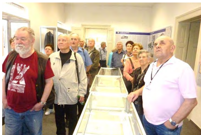
S průvodcem (vpravo) sledujeme film o parních lokomotivách.

hod. jízdy spotřebovala parní lokomotiva 5-6 tun uhlí, které se muselo ručně naházet do kotle.