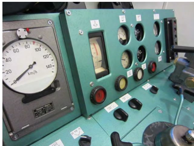
Trenažer lokomotivy, je možno se projet po reálných tratích.

jízdu vlaku ze Svinova do Opavy na trenažéru lokomotivy.