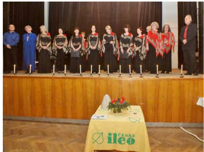
Vystoupení pěveckého sboru Canticorum.

kvalitu vzorků tekutého vánočního cukroví.