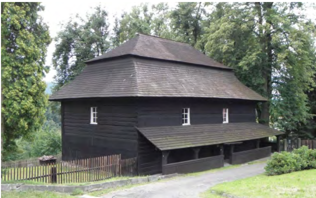
Evangelický kostel ve Velké Lhotě.

Po vydání tolerančního patentu v roce 1781 skončilo sice pronásledování protestantů, avšak budovy pro jejich církevní obřady se musely stavět podle přísných pravidel. Kostel z roku 1783 nemohl mít věž ani zvony a dokonce ani vstup do něj nemohl být obrácen k hlavní přístupové cestě. V letech 1875-1895 zde jako farář působil autor knihy Broučci Jan Karafiát. Pobyt tohoto kazatele připomíná pamětní deska na budově fary i naučná stezka.