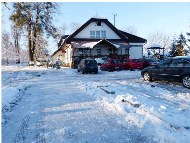
Krásná zimní pohoda Na skalkách.