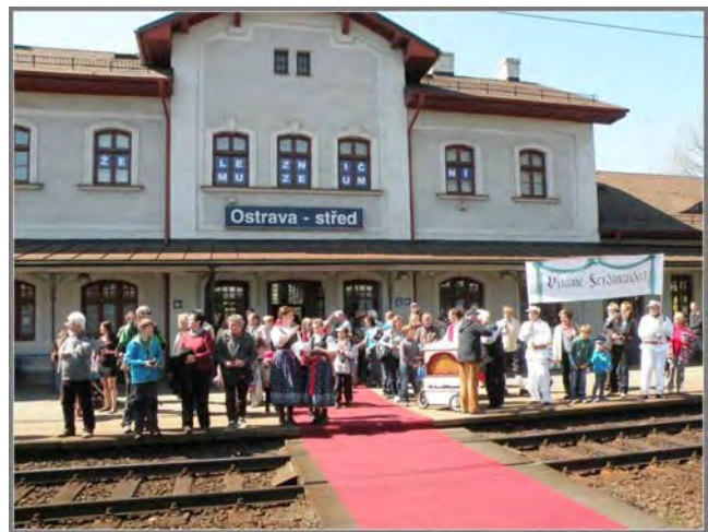
Uvítání císaře Ferdinanda před muzeem.

Termín prohlídky jsme zvolili tak, abychom stihli novou expozici s názvem „170. let trati Severní dráhy císaře Ferdinanda, Lipník – Bohumín“, která bude končit 16.4.2018.