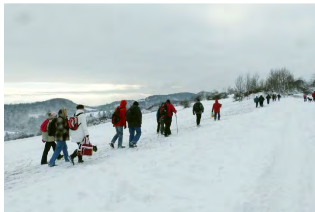
Cesta na vrchol Svince.