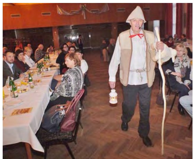
Předseda jako pastýř sleduje Betlémskou hvězdu.

Zcela netradiční bylo zahájení večírku. Nejprve jako pastýř přichází předseda s lucernou, holí a ovečkou. Sděluje, že se pastýřům zjevil anděl, který je vyzval, aby vyrazili do města Davidova, kde naleznou narozené děťátko.