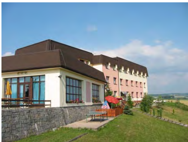
Penzionu Rozkoš v České Skalici.

Jelikož loňský třídní zájezd se Vám velmi líbil, připravujeme i letos zájezd třídní. Letos zamíříme do severovýchodních Čech. Ubytování s polopenzí je zajištěno v Penzionu Rozkoš v České Skalici.