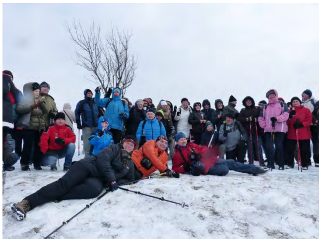
Nezbytná vrcholová fotka.

nealko šampíčko a jen malý ohňostroj, protože foukal velmi silný vítr.