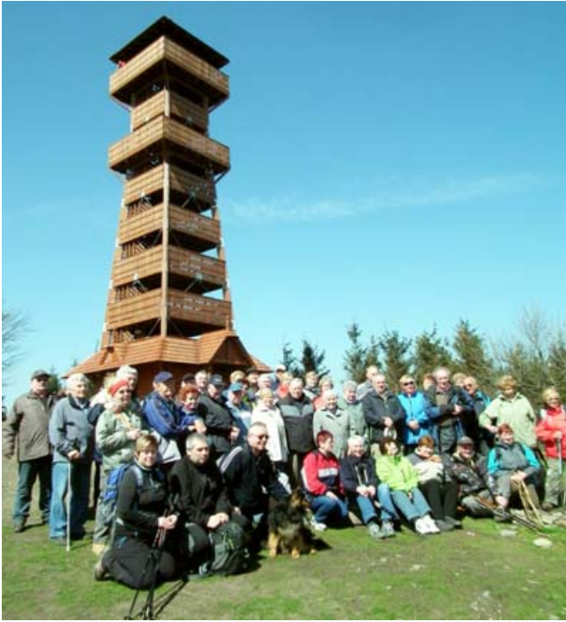
Nová rozhledna na Velkém Javorníku.

Krásná procházka probouzející se jarní přírodou nás po necelých dvou hodinách přivedla až na vrchol. Překvapil mě zejména nový člen spolku stomiků Novojičínska, který cestu nahoru zvládl měsíc po operaci, kdy mu byla vytvořena stomie. Klobouk dolů! Organizátoři však pamatovali i na starší členy. Vyřídili povolení pro několik aut, která je mohla vyvézt nahoru.