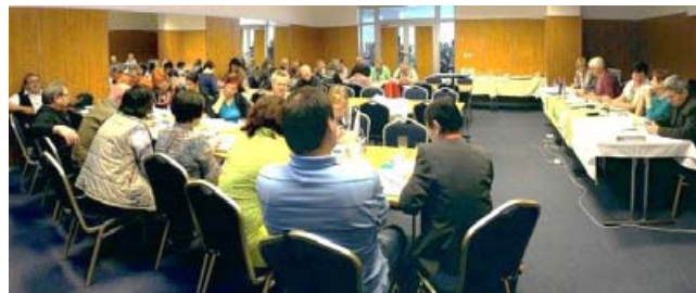
Valné shromáždění 22.3. v Brně.