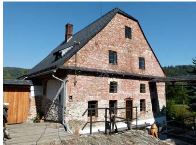
Vodní mlýn Wesselsky.

Odře. Vodní mlýn je unikátní svým zachovalým hospodářským areálem, ale především pak udržovanou originální mlýnskou technologií.