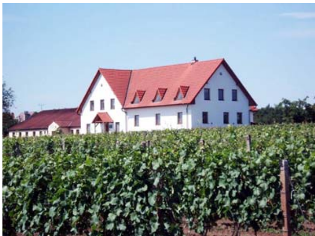
Penzion U Osičků ve Velkých Bílovicích.

Již od roku 1994 vždy v polovině června vyrazíme na zájezd za poznáním krásných míst na Moravě. V tomto roce se chceme vrátit k tradici třídenních zájezdů, které v minulosti pořádal klub Nový Jičín. Tyto zájezdy se vyznačovaly jedinečnou atmosférou spojenou s mnoha zážitky.