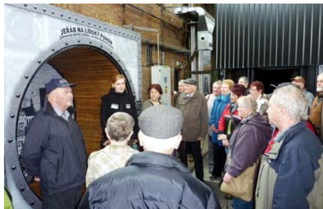
U6 – Svět techniky.