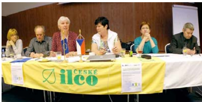
Předsednictvo Českého ILCO.