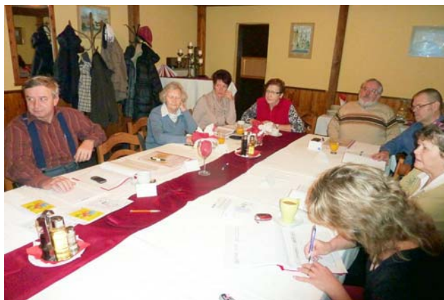
Školení dobrovolníků v Ostravě.