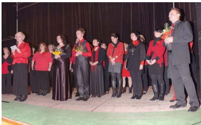
Pěvecký sbor Canticorum z Havířova.

Jednou z nejoblíbenějších akcí v roce bývá tradiční vánoční večírek v Kulturním domě v Ostravě-Petřkovicích. Sešlo se nás tam 16. prosince přes sto, z toho 74 osob z našeho klubu a 12 hostů z klubů Opava, Nový Jičín a Přerov. Dalšími vzácnými hosty pak byli zástupci firem ConvaTec, ALP, Eakin, Lipoelastic, B-Braun, Dansac, Malkol a Sabrix, kterým jsme měli příležitost poděkovat za veškerou podporu a pomoc, kterou nám poskytovali během celého roku. Myslím, že mezi nás do Petřkovic jezdí i v tom předvánočním shonu rádi.