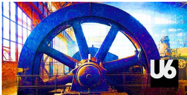
Svět techniky – interaktivní expozice U6.

Interaktivní expozice U6 odhaluje tajemství technických vynálezů od parního stroje až po nejmodernější robotizovaná pracoviště a „superchytře“ stroje. Jejím cílem je zábavnou a interaktivní formou přiblížit technické obory historicky tradiční v našem regionu. Pro jednotlivé části expozice jsou použity názvy světově známých vědecko-fantastických knih Julese Verna, jehož datum narození (1828) je identické s rokem zrodu Vítkovických závodů.