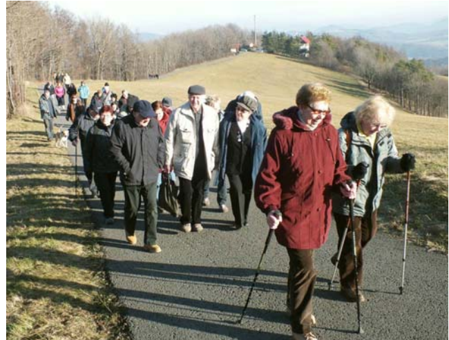
Krásná procházka od chaty na vrchol Svince.

nejméně patnáctkrát. Za tu dobu jsem zažil nejrůznější počasí. Chumelenici, vichřici, mlhu, jinovatku, déšť nebo mráz. Takový krásný den, jaký byl 30. prosince loňského roku však nepamatuji. Sluníčko svítilo jako na jaře, v údolích mezi kopci se protahovaly lehounké závoje mlhy, klid, pohoda, nádherné výhledy. Den jako malovaný. Sluníčko vylákalo rekordních 62 účastníků, z toho bylo 21 členů našeho klubu a to je také nové maximum.