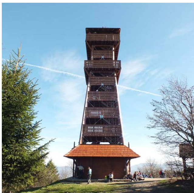
Rozhledna na Velkém Javorníku.

ILCO Novojičínska spolek, stomiků Vás srdečně zve na krátkou jarní procházku z Veřovic na Velký Javorník, kde byla v loňském roce 2013 otevřena nová rozhledna.