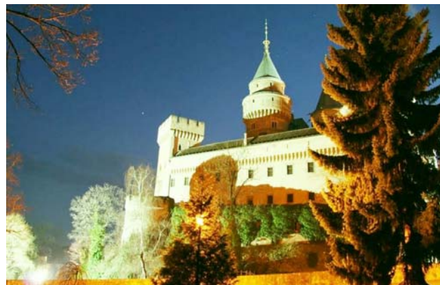
Bojnický zámek v noci.