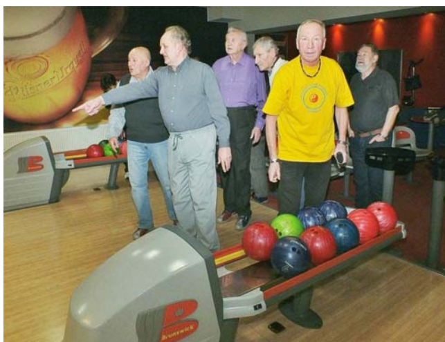
Podívejte, kam to zase letí!

Plán akcí byl projednán na společném zasedání výborů klubů z Ostravy, Opavy, Nového Jičína a Přerova dne 24.1.2014 v Ostravě. Před vlastním jednáním byl sehrán tradiční turnaj v bowlingu.