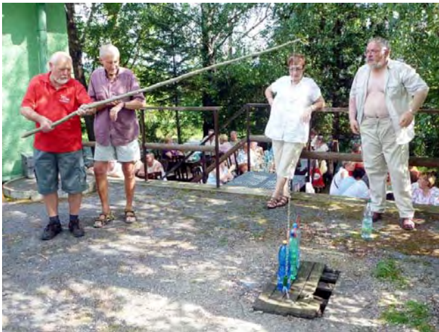
Soutěž v netradičním rybolovu.