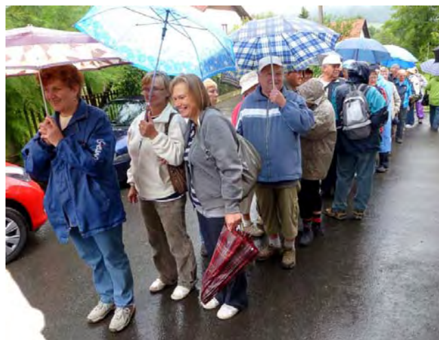
V dvojstup nastoupit! Bude se počítat!

V drobném dešti vyrazíme na naše šestikilometrové putování kolem Rybí. Je zde velký podzemní zásobník plynu s řadou čerpacích míst, která jsou propojená asfaltovými silničkami.