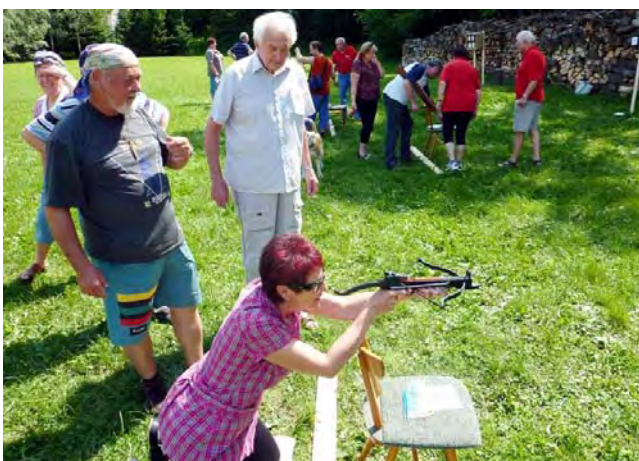
Střelba z kuše vyžaduje soustředění.

Tohoto již tradičního sportovního klání, které pořádá Opavský klub stomiků se zúčastnilo v celkovém počtu 29 členů ze tří klubů.