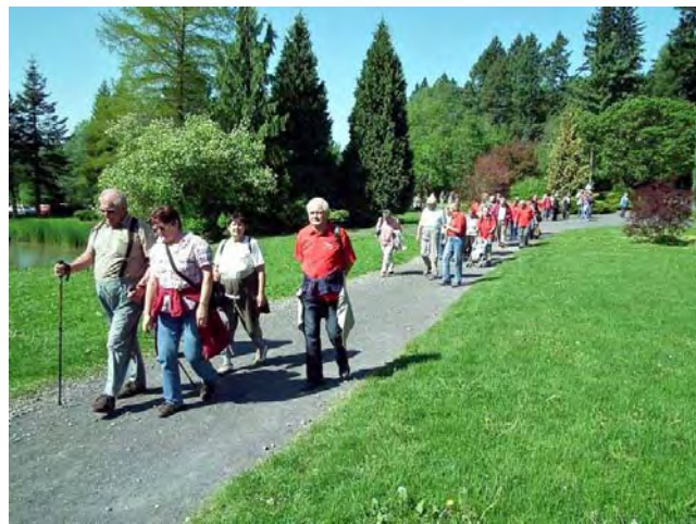
Procházka Arboretem Nový Dvůr.