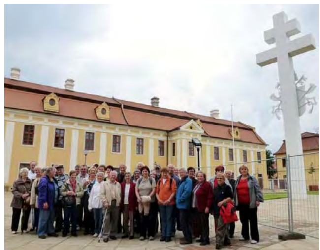
Před bazilikou na Velehradě.

Za deštivého počasí jsme odjžděli v ranních hodinách a naše první zastavení bylo v krásném městě Uherské Hradiště, kde na nás již čekala milá průvodkyně, která se nám věnovala a provedla nás po zajímavých místech spojené s výkladem historie tohoto města. Pak jsme měli možnost každý samostatně se porozhlédnout po tom co ho zajímalo. Počasí nám zpočátku příliš nepřálo, ale později se ukázalo i sluníčko a začalo být příjemnější.