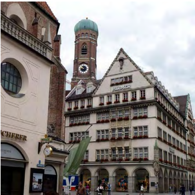
Historická část Mnichova.

V neděli dopoledne jsme měli možnost se projít starým městem. V Mnichově je toho opravdu hodně k vidění a chtělo by to více než 2 hodiny, které jsme měli my.