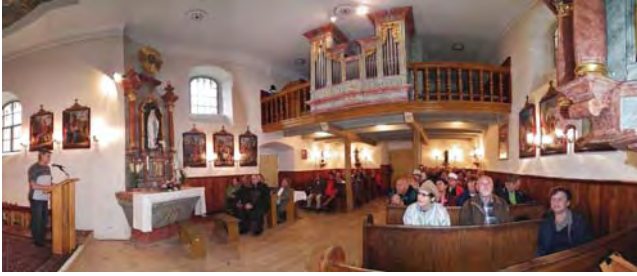
V kostelíku Povýšení sv. Kříže.

z klubu organizujícího akci. Postupně se utváří několik skupinek, které diskutují, vyprávějí a baví se. Je již skoro čas na večeři a nikomu se nechce domů. Je to skvělá parta lidí, taková jedna trochu větší rodina.