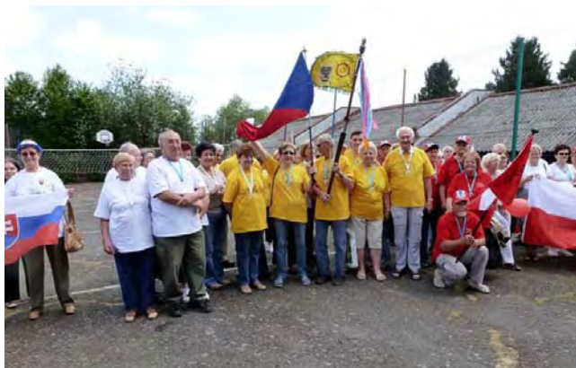
Česká skupina při slavnostním zahájení.

Do cíle jsme dojeli přes město Bialsko Biala až do obce Tresna k areálu sportovního střediska pro surfing a jiné vodní sporty, k turistickému hotelu ODYS.