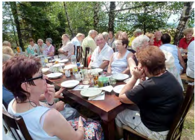
Příjemné posezení pod břízami.

Loňský rybářský den ve Stříteži u Českého Těšína měl velmi dobrý ohlas a tak není divu, že jsme se do Stříteže po roce opět vrátili. Tentokrát to nebyly rybí speciality, ale méně zdravé, ale o to chutnější vepřové hody.