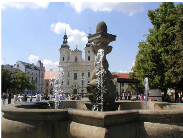
Uherské Hradiště - barokní kašna s delfíny.

Historickým městem roku 2011 se stalo - Uherské Hradiště. Jihomoravské město, které roku 1257 založil král Přemysl Otakar II., získalo tento prestižní titul v Programu regenerace městských památkových rezervací a městských památkových zón, který každoročně vyhlašují ministerstva kultury a pro místní rozvoj. Za sebou nechalo další dva finalisty, Chrudim a Kutnou Horu.