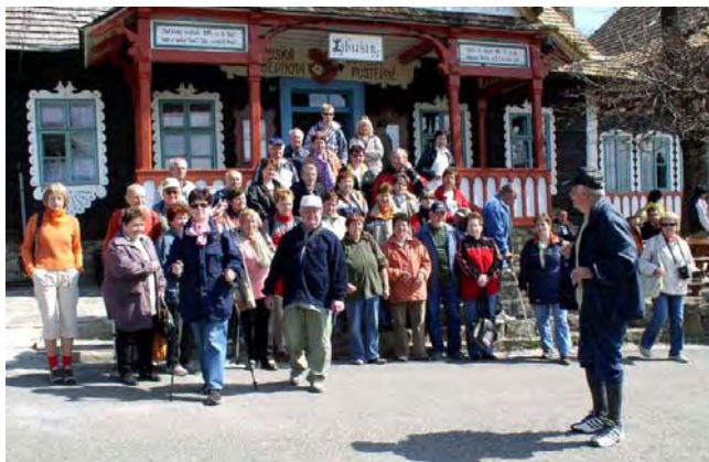
Na Pustevnách před čtyřmi lety.

Sraz bude v 10:00 hodin před chatou Libušín na Pustevnách. Na Pustevny můžete pohodlně vyjet lanovkou z Ráztoky nebo přímo autem z Prostřední Bečvy.