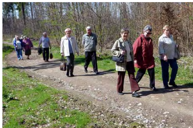
Pohodlná cesta lesem na Mexiko.

Počasí nám opět přálo, byl nádherný slunečný den a to je všechno hned mnohem hezčí. Sanatoria Klimkovice jsou moderní lázně s účinnou jodobromovou vodou, která pomáhá při léčbě pohybového ústrojí a neurologických či gynekologických nemocí. Příznivě působí též na cévní systém. Jsou zde dva hlavní pavilony, jeden pro dospělé a jeden pro děti. Provoz zde začal v roce 1994.