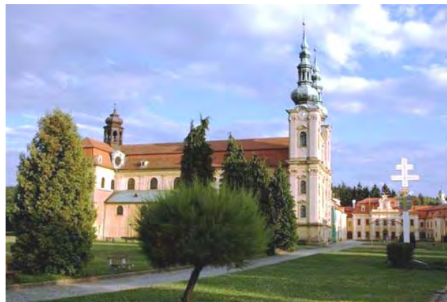
Velehrad - Bazilika Nanebevzetí Panny Marie.

Počátky současného Velehradu sahají na začátek 13. století, kdy zde vznikl první cisterciácký klášter na Moravě. Založil jej moravský markrabě Vladislav Jindřich v blízkosti vesnice Veligradu (dnes Staré Město).