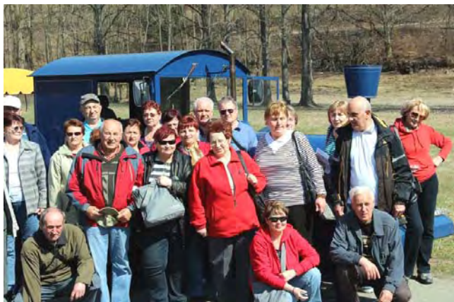
Autovláčkem do Pozlovic.

Během rekondičního pobytu nás čekaly masáže, plavání v bazénu a nezbytné prezentace od dodavatelů stomických pomůcek. Stomici si se zaujetím vyslechli novinky a zejména cenové úpravy pro nás, neboť od 1. 4. 2012 začala platit nová kategorizace zdravotních pomůcek podle novely zákona č. 48/1997 Sb.