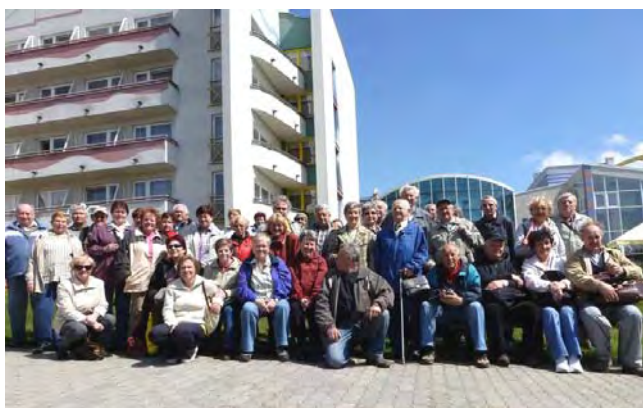
Před sanatorií v Klimkovicích.

Hornické muzeum Landek (2002), Důl Michal (2003), Planetárium J. Palyzy (2004), Věž ostravské Radnice (2005), Z hradu do ZOO (2006), Prohlídka Ostravského muzea (2007), Halda Ema a Keltičkova kovárna (2008), Pivovar Ostrava (2009), Z Třebovic do Děhylova (2010), Výstava o Janu Lucemburském v Ostravském muzeu (2011).