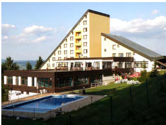
Horský hotel Jelenovská.

Rekondiční pobyt je největší a také nejoblíbenější akcí našeho klubu. Letošní rekondiční pobyt je jubilejní 20. a bude se konat 26.9. - 30.9.2012 v horském hotelu Jelenovská u Valašských Klobouk. Pamětníci si na tento hotel vzpomenou z rekondic před 10 a 11 lety.