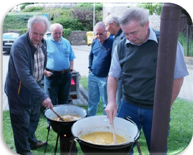
Dva kotlíky vaječiny v loňském roce.

Místo: Velká Polom, v motorestu "U Tvrze". V případě teplého počasí se dá sedět na terase, v případě špatného počasí uvnitř. Smažit budeme na terase.