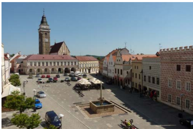
Náměstí ve Slavonicích.