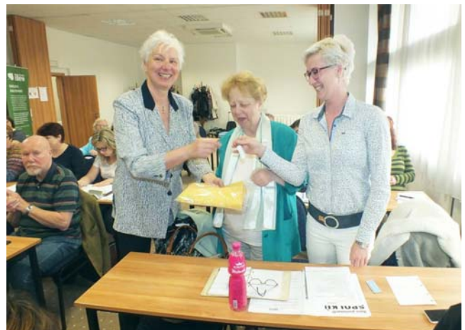
Zástupkyně nového klubu z Havlíčkova Brodu.