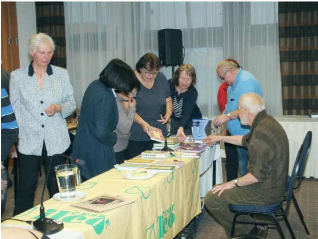
Zájemci o knihy Václava Větvíčky.

názvem. Tady se už vrací ke svým pocitům a prožitkům v nelehkém období, které musela překonat.