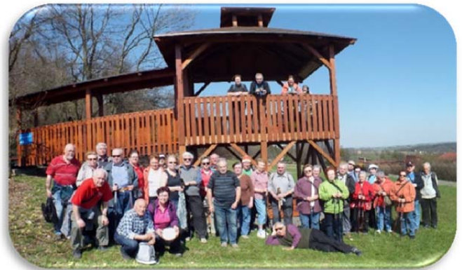
Pod Hyvnarovou vyhlídkou.

Asi každý z nás se těší po zimě na příchod jara. Přiznám se, že já obzvlášť, když se dozvím, že ho mohu přivítat se spolkem stomiků Novojičínka.