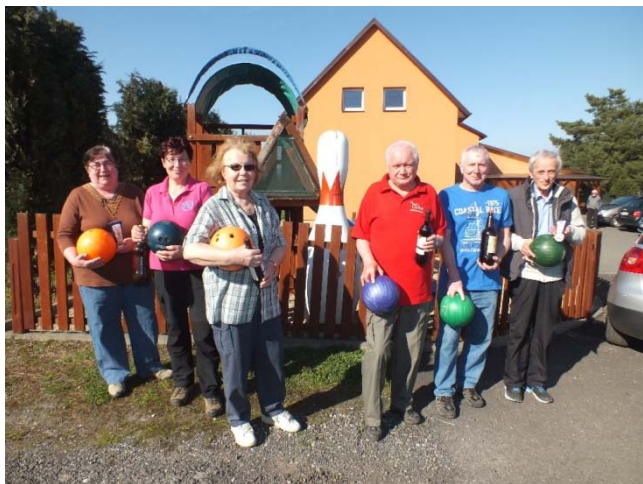
Vítězné turnaje v bowlingu.

s mírným stoupáním a možností odpočinku na upravených odpočívadlech a byla velmi dobře značená. Stezka s vyhlídkou byla otevřena teprve v roce 2015. Trochu nás překvapilo, že samotná vyhlídka byla vlastně pod kopcem, ale s krásným rozhledem až na Porubu v Ostravě. Jelikož bylo velmi krásné počasí, mohli jsme spatřit i Lysou horu, Radhošť, Hukvaldy, Velký Javorník a samozřejmě vesnici Závašice, která ležela hned pod námi.