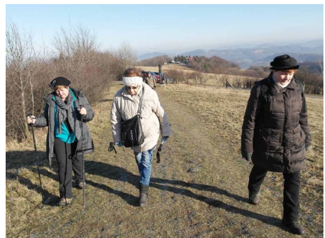
Krásné výhledy cestou k vrcholu.

Léta se setkáváme se spřátelenými kluby stomiků na chatě Svinec, která se nachází u horní stanice lyžařského vleku místního skiareálu. Ani letos tomu nebylo jinak. 30. prosince se nás za krásného slunného skoro jarního počasí sešlo celkem padesát čtyři. Chata Svinec ležící ve výšce 518 m nám nabízí své prostory k první zastávce a malému občerstvení.