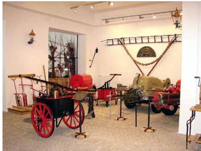
Expozice Hasičského muzea v Ostravě.

ukázky současné techniky, pracoviště Integrovaného bezpečnostního centra, modelových situací, spolupráce integrovaného záchranného systému a ukázky záchranných prací ve výšce a nad volnou hloubkou.