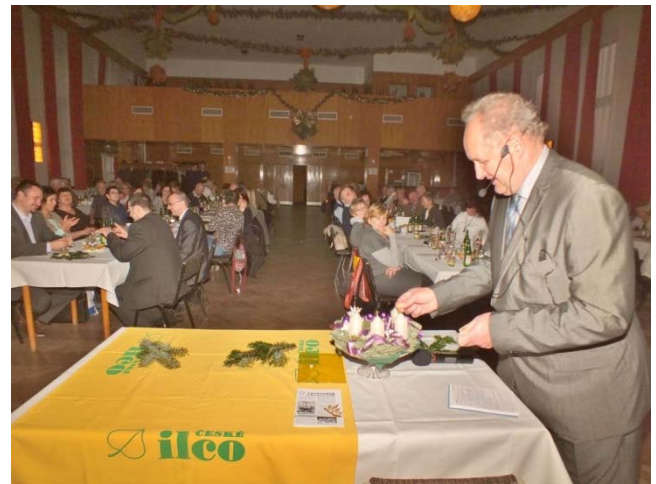
Předseda zapaluje čtvrtou adventní svíci.

Vánoční večírky v Ostravě-Petřkovicích jsou vždy pěknou tečkou za klubovými akcemi v kalendářním roce a nejinak tomu bylo i 19. prosince 2016.