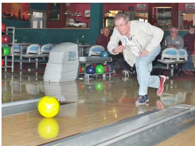
Tak to kouli mistr.