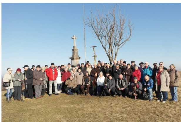
Vrcholová fotografie nemůže chybět.

Po posezení a ochutnávce našich výrobků v podobě klobás, škvarků, cukroví a rovněž tekutých specialit jsme od chaty pokračovali chodníčkem Václava Bártka po plochem travnatém hřebeni. Z něj se otevírají fantastické výhledy jak k západu ke Starojickému kopci s hradem Starý Jičín a k Oderským vrchům, tak k východu na Moravskoslezské Beskydy a Palkovické hůrky. Cesta nás přivádí k informační tabuli a z jejího textu se dozvídáme, že jsme na okraji přírodní rezervace Svinec o rozloze 38,25 ha. Vyhlášena byla v roce 1995 a předmětem ochrany jsou louky a remízky s bohatou květenou.