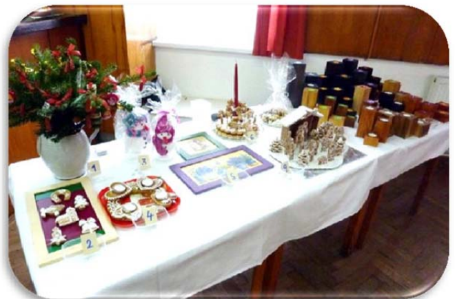
Soutěžní výstavka rukodělných prací.

Pro mě osobně to bylo takové pohlazení po duši a věřím, že i pro většinu z celkového počtu 91 hostů, z nichž 66 bylo našich členů, zbytek tvořili spřátelené kluby Opava, Nový Jičín a Přerov a samozřejmě nechyběli ani zástupci firem ConvaTec, ALP, Eakin, Lipoelastic, B-Braun, Dansac, Sabrix, Coloplast a naše stomasestřičky. Všem jsme tak mohli poděkovat za podporu a pomoc, kterou nám poskytovali během celého roku.