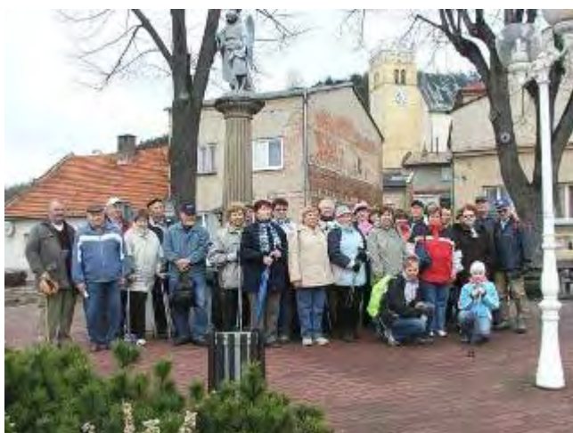
Nezbytná společná fotka na Starém Jičíně

krásné panoráma krajiny a pak jsme vystoupili do hezky zrekonstruované hradní věže, kde jsou mimo jiné obrazové a textové informace o historii hradu. Starojický hrad byl založen na přelomu 12. a 13. století. Měl funkci strážního hradu spolu s hradem Šostýn u Kopřivnice a hradem Hukvaldy u obce Kozlovice na Frýdecko-Místecku. Tyto hrady měly v dávných dobách střežit cestu od Dunaje k Baltickému moři, známou v době římské jako Jantarová stezka. Vyhlídka do okolní krajiny je i geologicky zajímavá, neboť oblast se nachází na předělu horstev - prvohorního zemského vrásnění starších horstev, u nás známých jako Český masív a geologicky mladších horstev - Alpinského třetihorního vrásnění. A tento předěl, snížený mezi nimi, tvoří Moravskou bránu. Ta je každoroční trasou tam i zpět pro stěhovavé ptactvo.