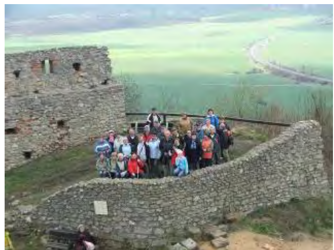
Nádherný výhled z hradu

Fotky Broni Tučného z tohoto výletu naleznete na stránce: