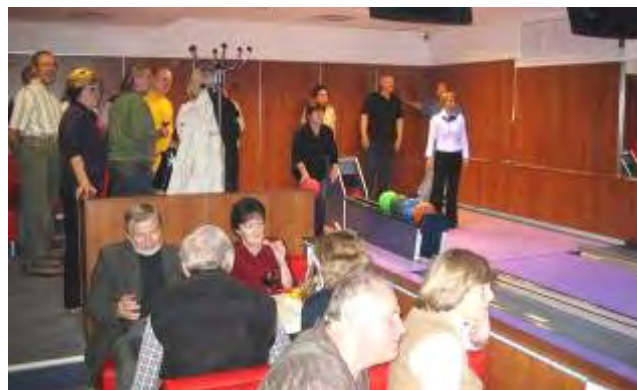
Hodně se diskutovalo a fandilo

Stomici z Česka velice rádi využili pozvání na setkání zástupců klubů stomiků v hotelu Avanti. Současně také bylo možné uspořádat i jednání předsednictva Českého ILCO a dokončit předávání agendy mezi starým a novým výborem včetně projednání usnesení a schválení valnou hromadou.