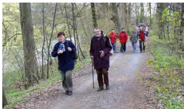
Procházka kolem Opavy byla nenáročná

Společně jsme se vydali na procházku údolím řeky Opavy z Třebovic do Děhylova. Za ideálního počasí jsme mohli pozorovat probouzející se přírodu v meandrech řeky Opavy a v přírodní rezervaci Štěpán. Přírodní rezervaci Štěpán tvoří rybník Štěpán s okolními mokřady, kde jsou na několika místech tůňe. Rybník a mokřady obklopuje lužní les s jilmovými doubravami a mokřadními olšinami. Cesta po asfaltové silnici a chodníku byla velmi pohodlná a tak ji zvládli i členové s holemi.